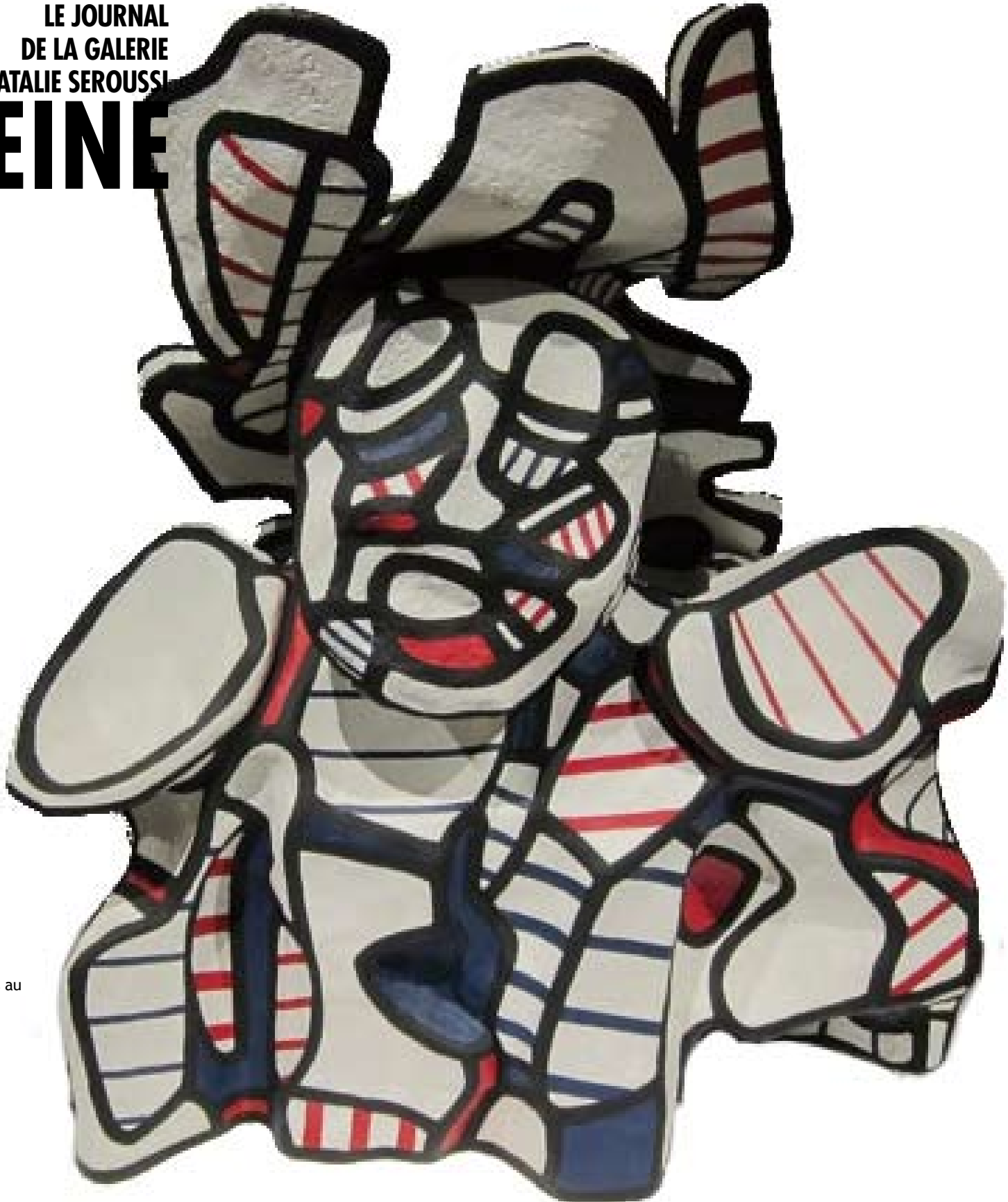
JEAN DUBUFFET Le Pirate , 1975 Masque en polyester & camisole en époxy, peints au polyuréthane 109 x 98 x 62 cm