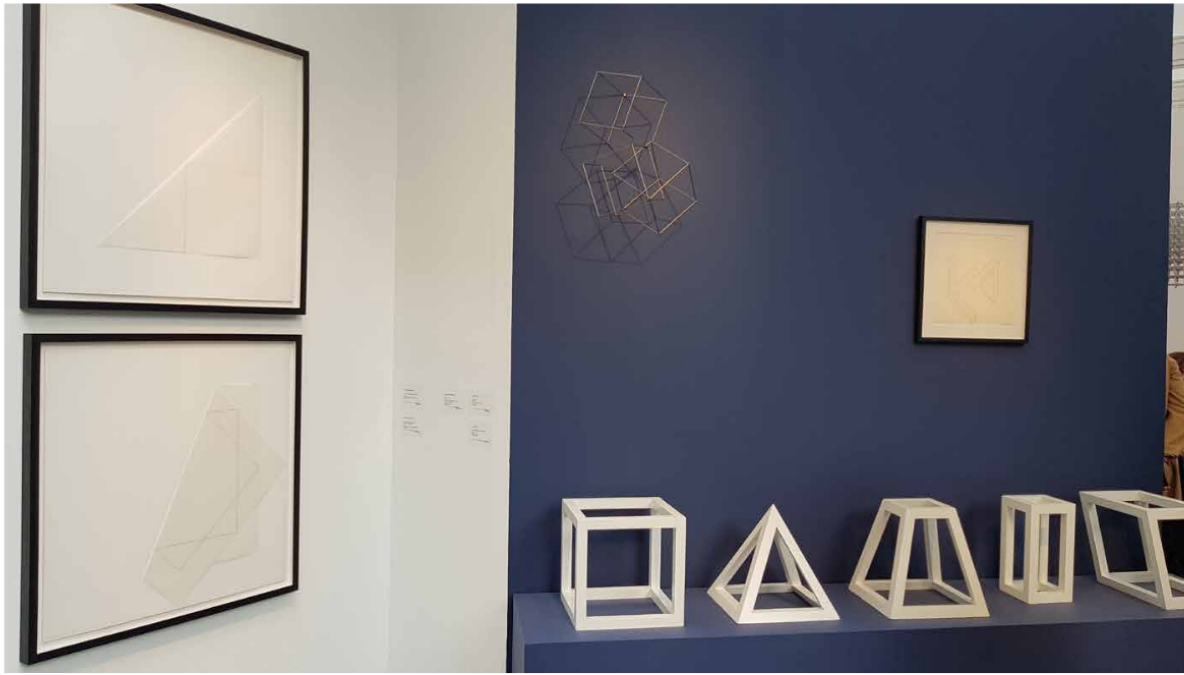
Œuvres de Sol LeWitt sur le stand de la galerie Zlotowski.