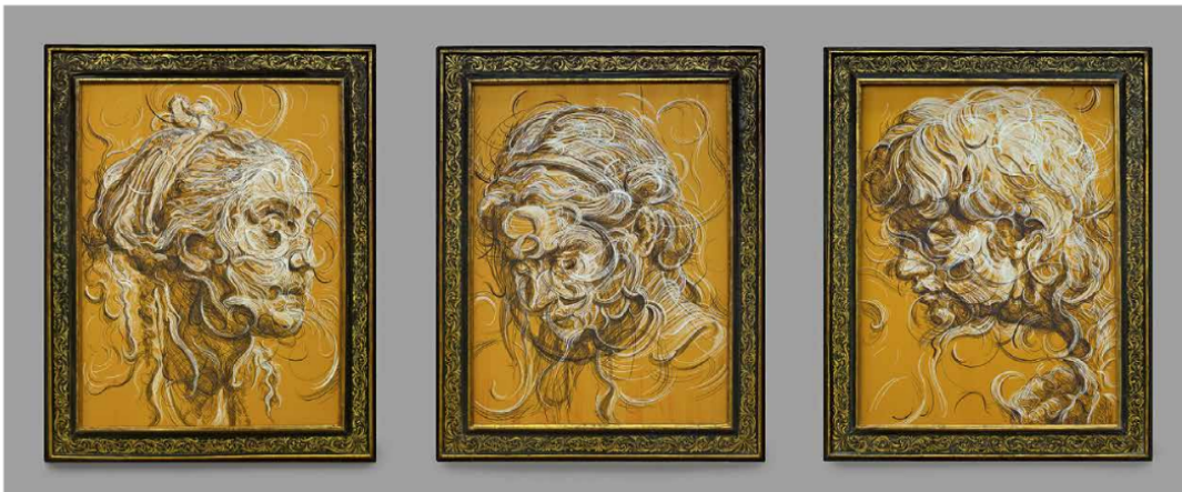
A new, better, faster breed, 2019, oil and acrylic paint on panel, three parts in artist's frame, each panel 122.5 x 97.5 x 4.2 cm.

Galerie Max Hetzler Berlin | Paris | London maxhetzler.com