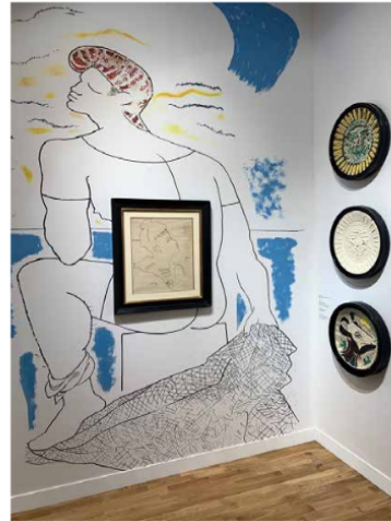
Vue du stand de la galerie Gagosian sur la FIAC 2019, avec un dessin de Cocteau et des céramiques de Picasso.