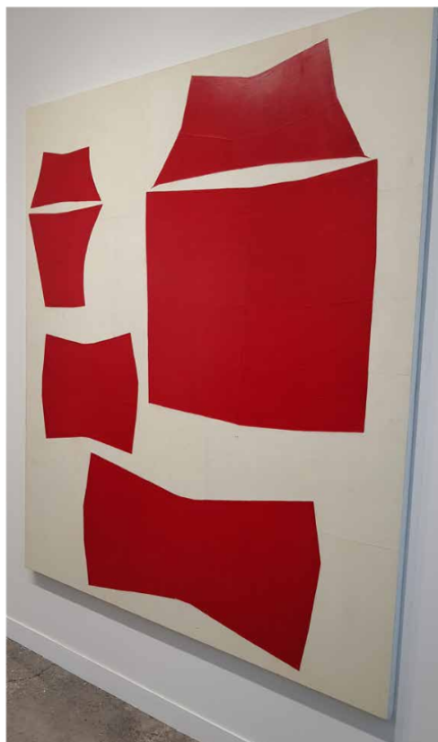
Ellen Gallagher, Untitled , 2000, huile, stylo et papier sur toile, 213,9 x 182,6 x 4,2 cm. Galerie Hauser & Wirth. Photo: A.C.

Yan Pei-Ming, L'artiste à 59 ans , Yan Pei-Ming, 2019, huile sur toile, 400 x 300 cm. Photographie: Clémence Morin © Yan Pei-Ming, ADAGP, Paris, 2019