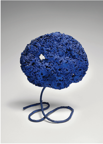
YVES KLEIN SE 229, 1959 pigment pur et résine synthétique sur éponge montée sur fer 25 x 20,5 x 12 cm