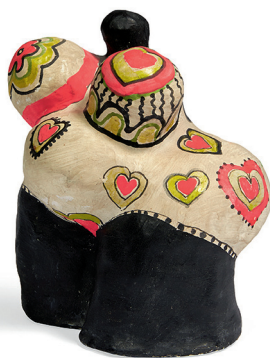
NIKI DE SAINT PHALLE Nana , circa 1967 plâtre original peint par l'artiste 17 x 14 x 12 cm