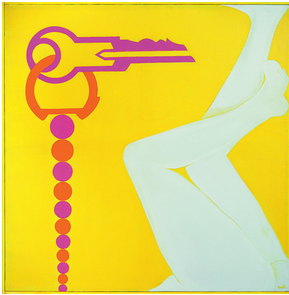
EVELYNE AXELL La Clef de contact jaune , 1966 huile sur toile 99 x 99 cm