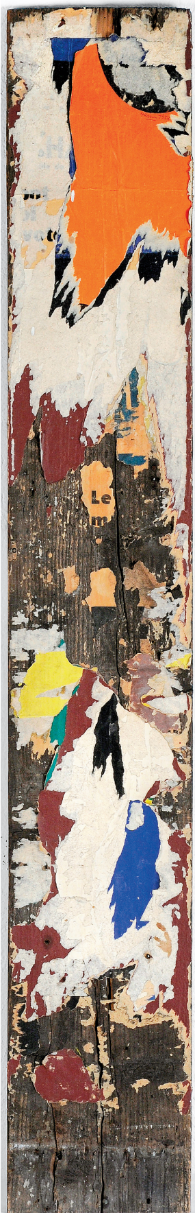
RAYMOND HAINS La planche de palissade, 1957 affiches lacérées sur planche 149 x 22,7 x 2,3 cm