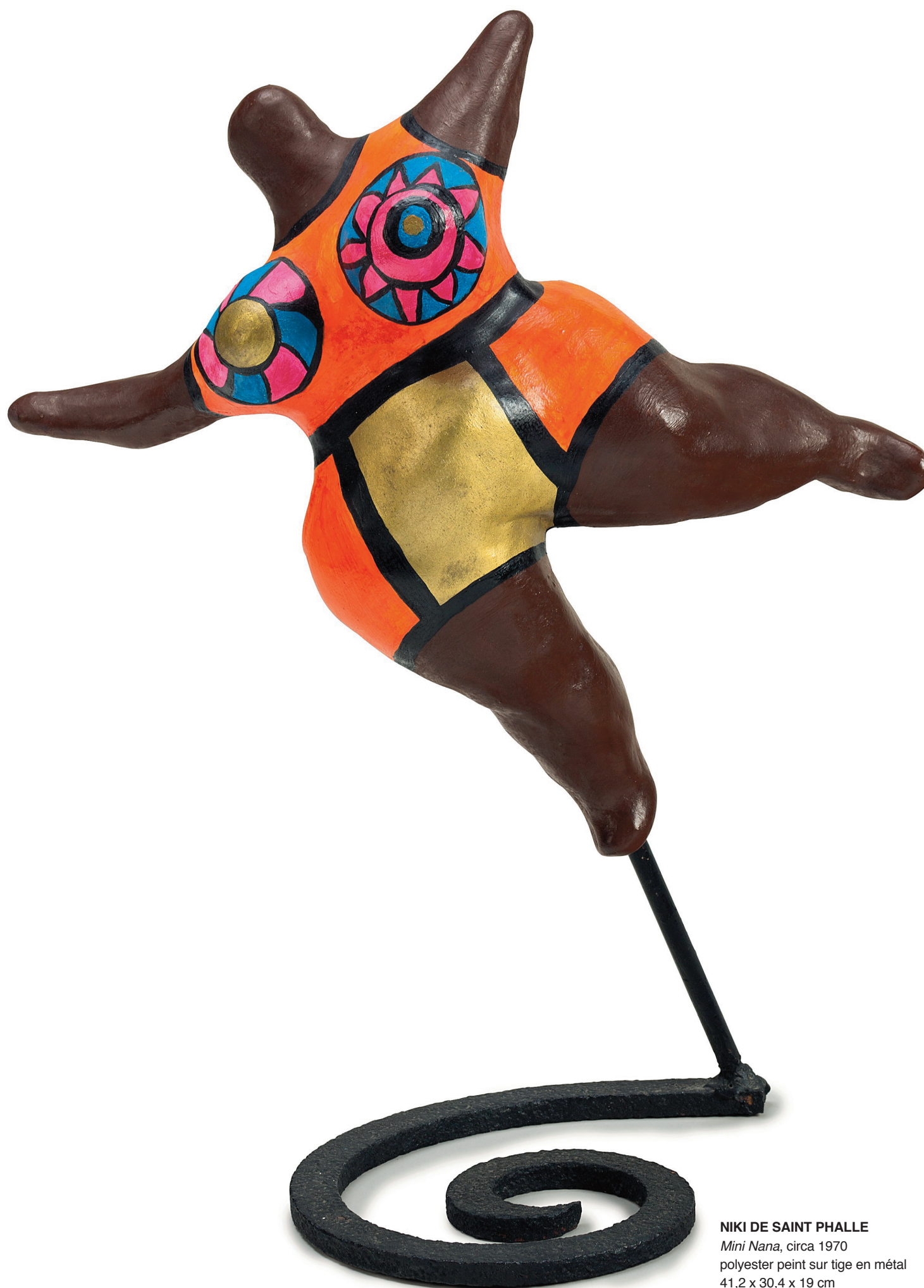
NIKI DE SAINT PHALLE Mini Nana , circa 1970 polyester peint sur tige en métal 41,2 x 30,4 x 19 cm