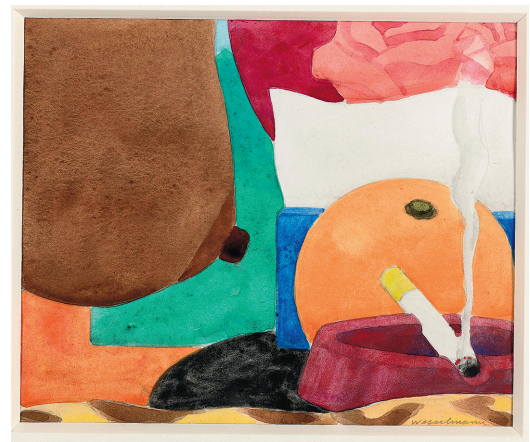
TOM WESSELMANN Drawing for bedroom painting #13, circa 1969 liquitex et crayon sur papier 14,6 x 17,8 cm