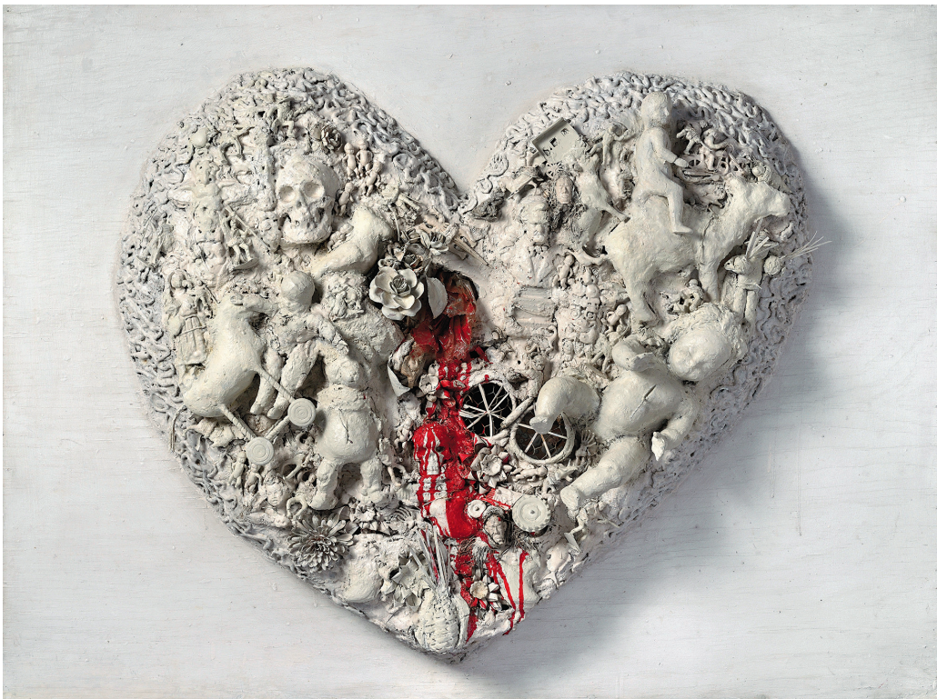
NIKI DE SAINT PHALLE Coeur (Heart N° 1) , 1963 peinture, plâtre, grillage et objets divers sur bois 45 x 65 x 6 cm