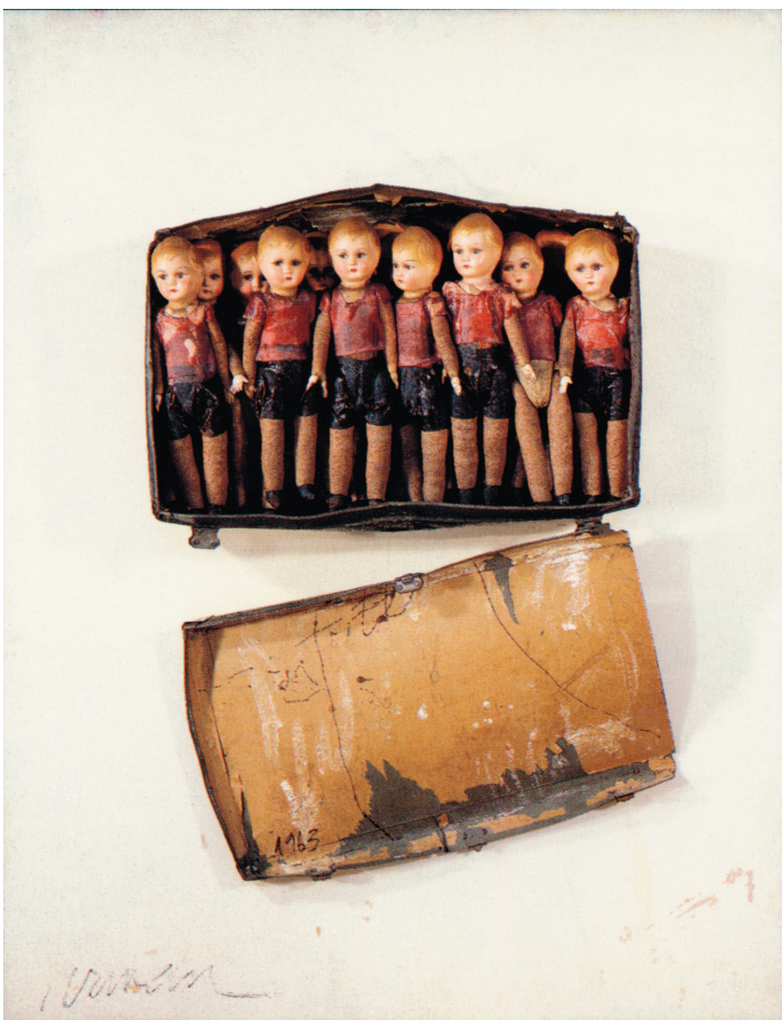
ARMAN Birth control , 1963 accumulation de poupées 156,5 x 121 x 32 cm