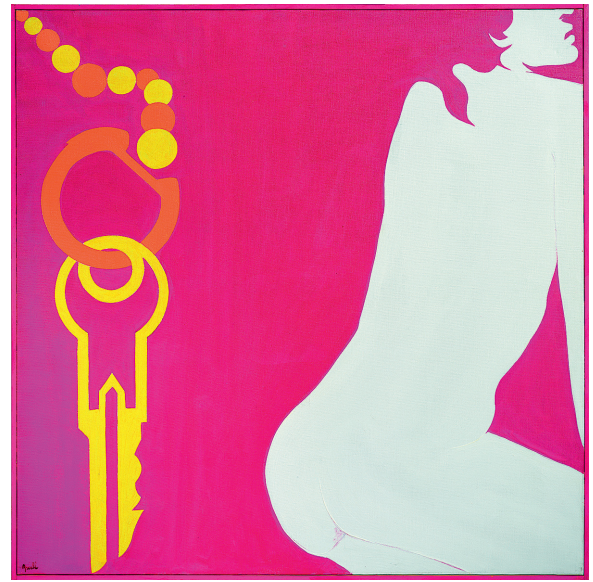
EVELYNE AXELL La Clef de contact rose , 1966 huile sur toile 99 x 99 cm