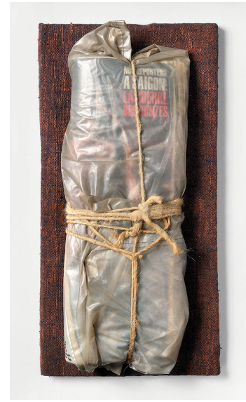
CHRISTO Magazines emballés (No reporters à Saigon) magazines, plastique et corde 49,5 x 30 x 10 cm