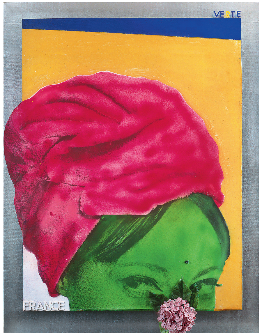
MARTIAL RAYSSE La France verte, 1963 peinture, photographie, collage et objets sur toile 150 x 116,5 cm