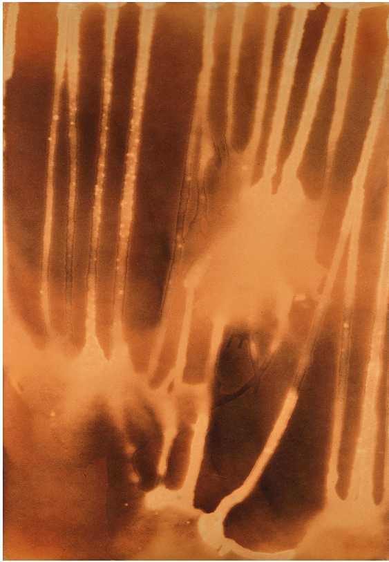
YVES KLEIN Carte de mars par l'eau et le feu, 1961 technique mixte sur carton sur bois 69 x 49 cm