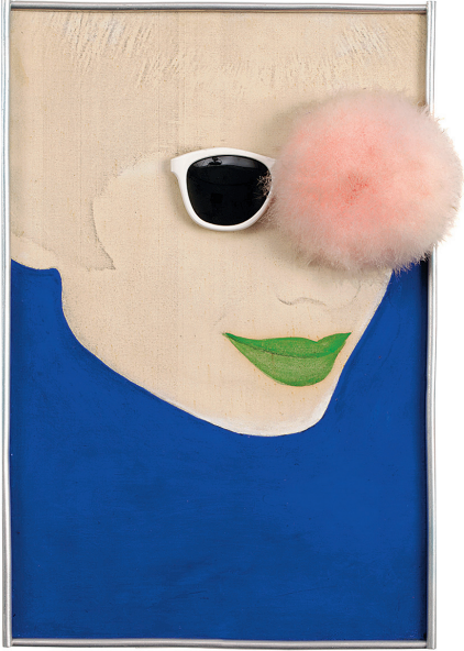
MARTIAL RAYSSE Verte , 1963 huile, collage, xérogaphie, houpette et lunettes sur toile 32 x 22,5 cm