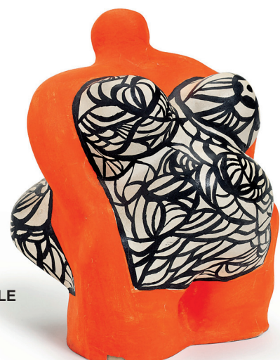
NIKI DE SAINT PHALLE Nana orange , 1972 plâtre peint 13,3 x 10,2 x 10,8 cm