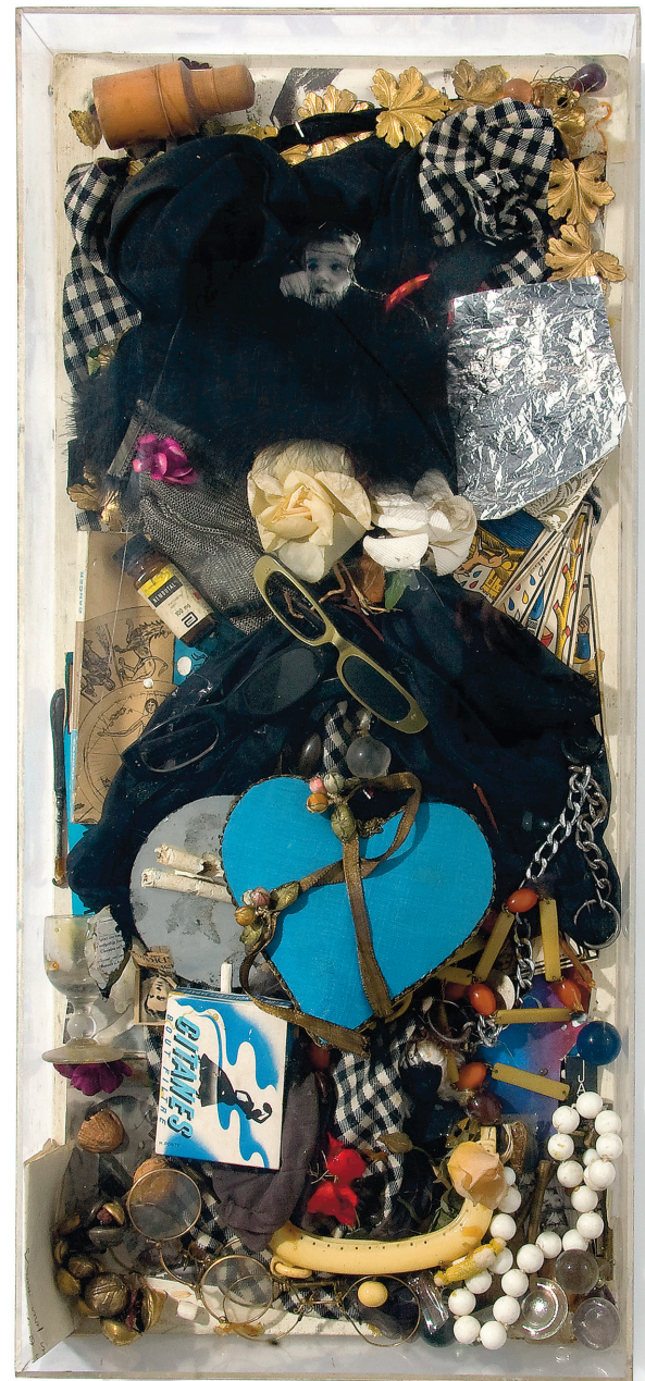
ARMAN Portrait robot de France , 1963 effets et objets personnels dans une boîte en plastique 73 x 33 x 9 cm